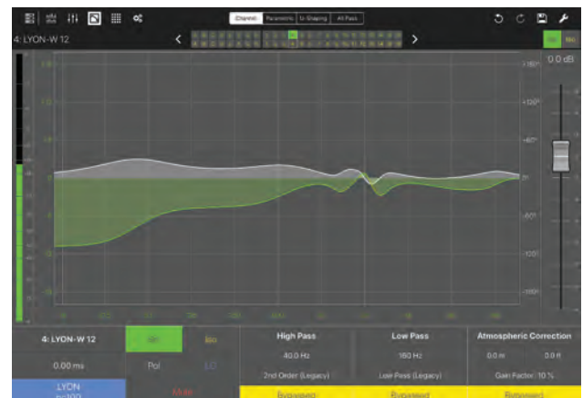
Compass Go Screen