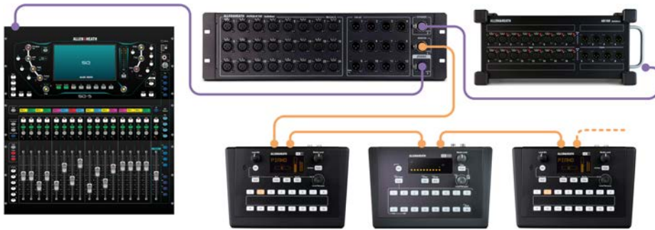
SQ + AR2412 + AB168 + ME system 40 remote inputs + 20 remote outputs + ME system