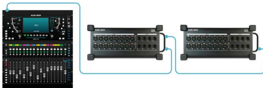
SQ + 2 x DX168 32 remote inputs + 16 remote outputs