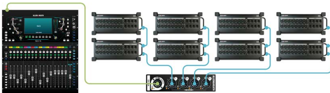
SQ + DX Hub + 8 x DX168 128 remote inputs + 64 remote outputs