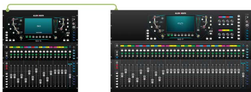
SQ + SQ 128 channels each way